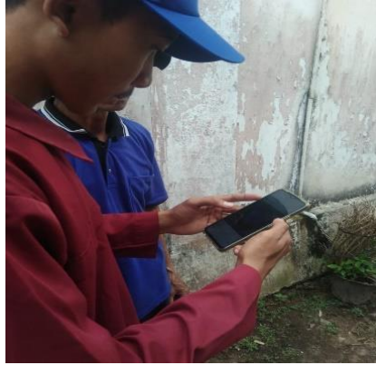
Gambar 2. Pelatihan dan pendampingan penggunaan dan cara posting produk ke sosial media bersama pelaku UMKM