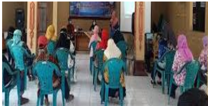
Gambar 3. Pelatihan pemasaran media online kepada pelaku usaha UMKM