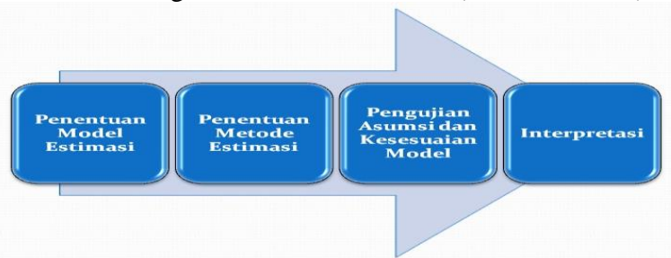
Gambar 3. Tahapan Analisis Panel Data

Dalam penelitian ini, analisis data dilakukan dengan menggunakan model regresi data panel. Data Panel atau kumpulan data adalah kombinasi dari deret waktu dan data cross-sectional. Regresi panel dapat mengakomodasi informasi yang terkait dengan variabel baik secara cross-section maupun time series dan secara substansial menurunkan masalah variabel yang comitted, model mengabaikan variabel yang tidak relevan (Frankl, 2005). Metode regresi panel lebih tepat untuk mengatasi interkorelasi antar variabel bebas yang pada akhirnya dapat menyebabkan penilaian model regresi secara tidak akurat (Griffiths, 2001).