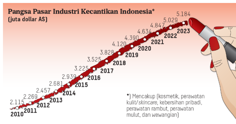
Gambar 1. Pangsa Pasar Industri Kecantikan Indonesia

Bahkan saat pandemi di kutip dari (Hasibuan, 2022) industri kecantikan tahan krisis bahkan laris manis walaupun pandemi covid 19. Perkembangan pangsa pasar industri kecantikan di Indonesia bersumber pada penggunaan produk kecantikan di Indonesia. Hal tersebut, tercermin dalam perilaku konsumtif wanita indonesia terbesar ke 2 di dunia.